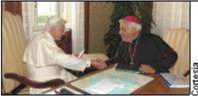
Dedicantes hoc quaecumque opus Reverendissimo et Excellentissimo Domino